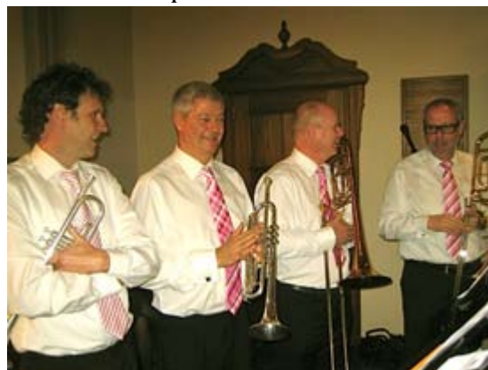
Trompettisten Brass Ensemble Bläseralta Vriendenconcert op 8 december 2013