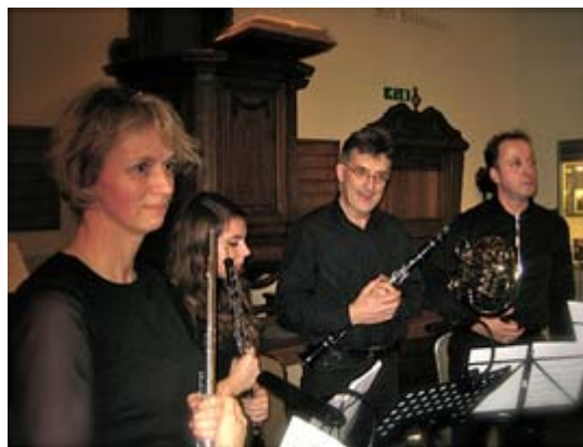
Kamermuziekensemble Cecilia Vriendenconcert op 8 december 2013

De toekenning van de Brim-subsidie door de Rijksoverheid is een belangrijke bouwsteen voor de toekenning van subsidie door de Gemeentelijke en Provinciale Overheid ten behoeve van de restauratie en herinrichting van het kerkje als rijksmonument.