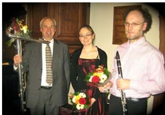
Trio Versatile, Nieuwjaarsconcert 11 januari 2013